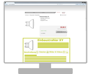
Ihr Shop mit loadbee

IDOCTYPE html> <!--[if lt IE 7]><html class="no-js lt-ie9 lt-ie8 lt-ie7"> <![endif]--> <!--[if lt 7]><html class="no-js lt-ie9 lt-ie8 ie7"> <![endif]--> <!--[if lt 7]><html class="no-js lt-ie9 lt-ie8 ie7"> <![en dif]--> <!--[if lt 7]><html class="no-js lt-ie9 lt-ie8 ie7"> <![endif]--> <head prefix="og: http://ogp.me/ns# fb: http://ogp.me/ns/fb# product: http://ogp- me/ns/product#">